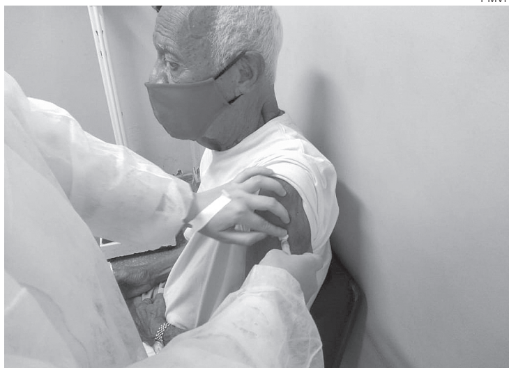
Imunização avançará conforme o Ministério da Saúde envie novos lotes da CoronaVac

Ainda sobre a AstraZeneca, a prefeitura relatou que, por enquanto, as entregas estão seguindo o cronograma. A prefeitura informou ainda que o ministro da Saúde, Marcelo Queiroga, afirmou nesta segunda-feira