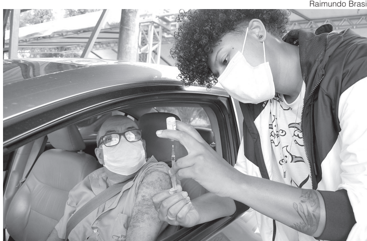
Serão vacinados àqueles que residem em bairros de fora da área de cobertura dos postos de saúde

– Vamos avançando aos poucos com a vacinação contra a Covid-19 em Resende de forma eficaz e com agilidade. Nesta terça-feira será a vez de idosos a partir de 60 anos que se cadastraram pelo site da Prefeitura. Reforçamos que apenas serão vacinados hoje, os idosos que receberam previamente a ligação das equipes da Prefeitura com o horário definido para não ter aglomerações