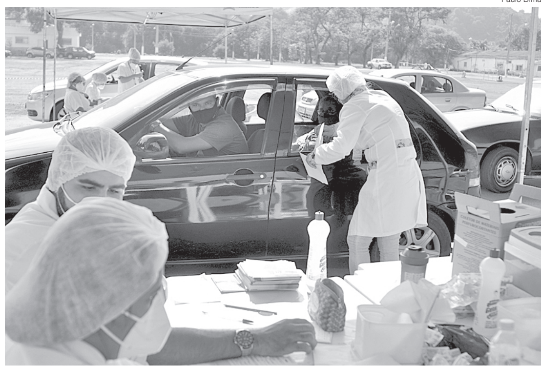
Idosos acima dos 60 anos receberam primeira dose de vacina

Ao todo foram notificados 50.276 exames como suspeitos, sendo que 37.505 já foram descartados e 372 são considerados suspeitos que aguardam resultados dos exames. Destes, 29 estão hospitalizados.