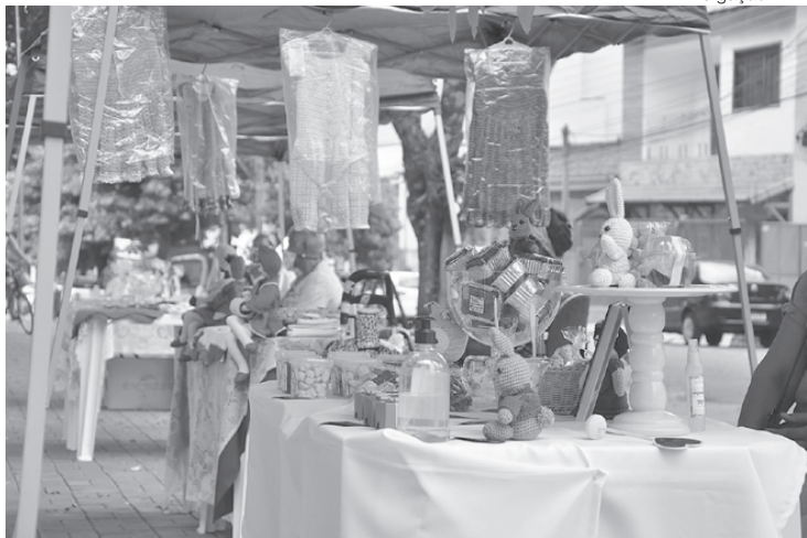
Feira será na próxima sexta-feira, de meio dia às 16h