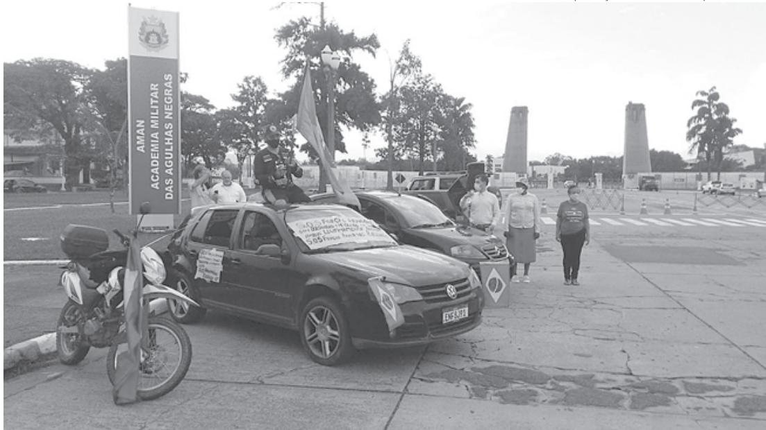
‘Vem pra Direita’ fez carreata de Volta Redonda à Aman, em Resende